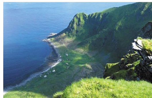
Bebyggelsen på Måstad. Foto midten: Måstadjellet.