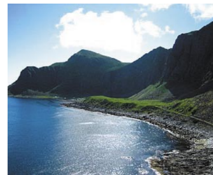
Fint oppmurt vei langs Måstadvika innover mot Måstad.