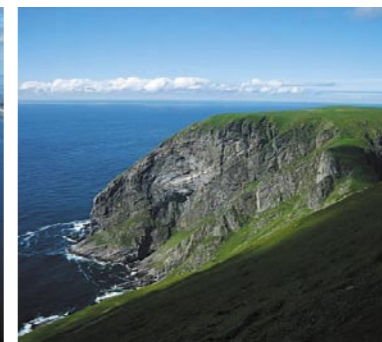
På vestsiden av Måstadjellet i landskapsvernområdet.