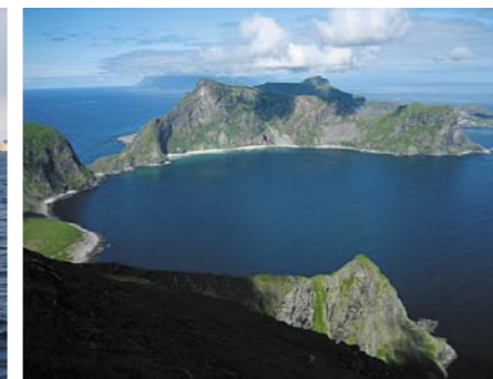
Måstadvika sett fra Måstadjellet. Bildet viser store deler av naturreservatet på Måstad. Bebyggelsen Sørland på Værøy bak til høyre, mens Lofoten ses i bakgrunnen.