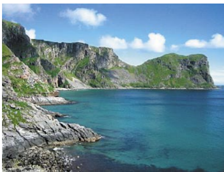
Nordsiden av Måstadvika sett fra ferdselsveien når du går over fra Eidet mot Måstad.