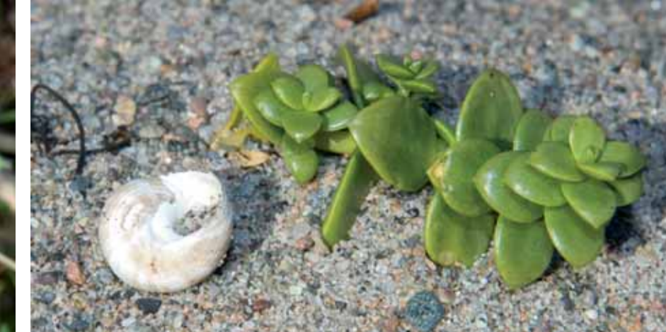
STRANDARVEN mestrer omskiftelige forhold