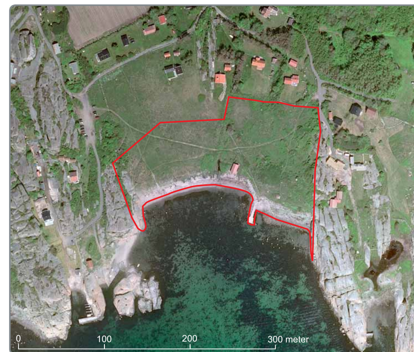
Strandlandskapet på Sønstegård huser et rikt og variert biologisk mangfold