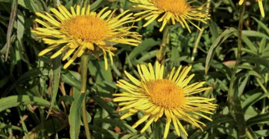
KRATTALANTENS gullgule kurver lyser lang vei