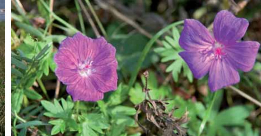
BLODSTORKENEBB, varmekjær kystplante som farger engene