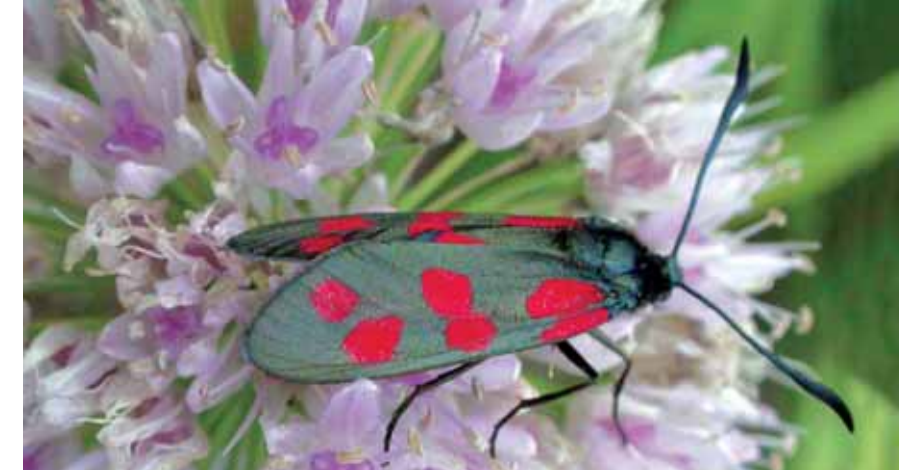
SEKSFLEKKET BLODDRÅPESVERMER på RØDKNAPP