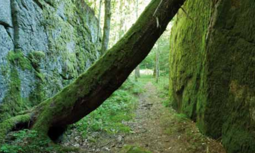
Rød-Dirhue har en rekke dype glover.