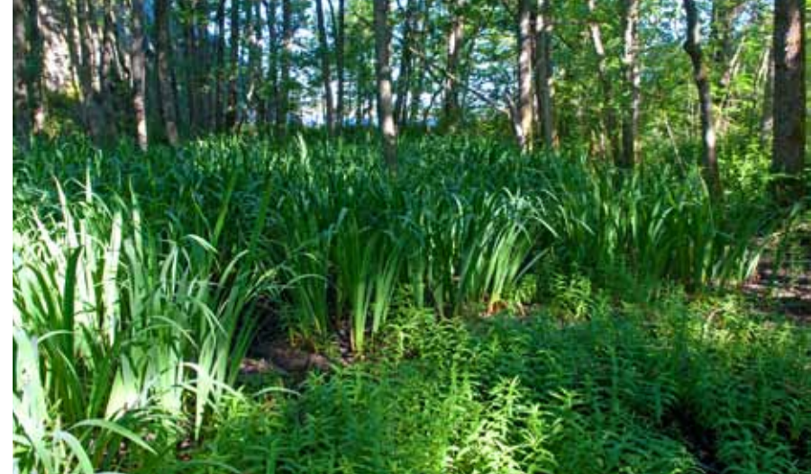
I sumpskogen nede ved sjøen finner man mye svartor og sverdlilje.