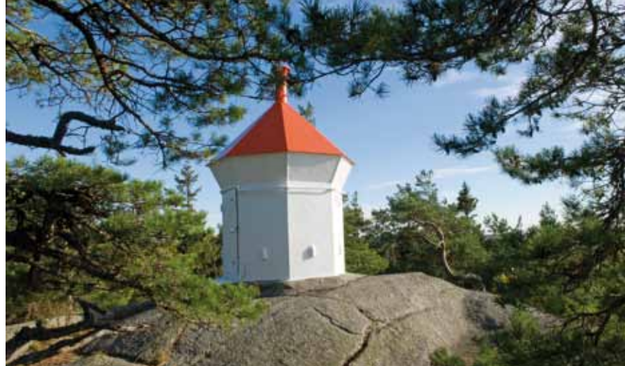
Oppe på de avskrapte knausene er den artsfattige kystfuruskogen.