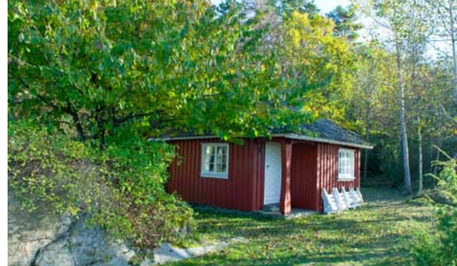
Berstad var Alf Larsens lille dikterstue.