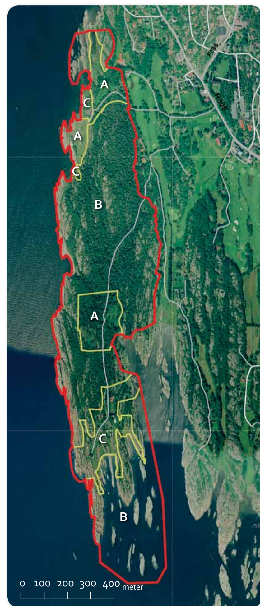
Kartgrunnlag: Tillatelsesnummer Statens Kartverk Måst 12002-R127454, tillatelsesnummer GEOVEKST GV-L-0700.